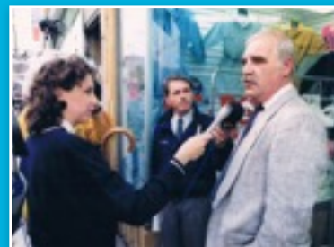
Photo prise à l'époque où France était journaliste pour une émission d'affaires publiques très populaire à la télévision québécoise, juste avant une période d'épuisement professionnel.